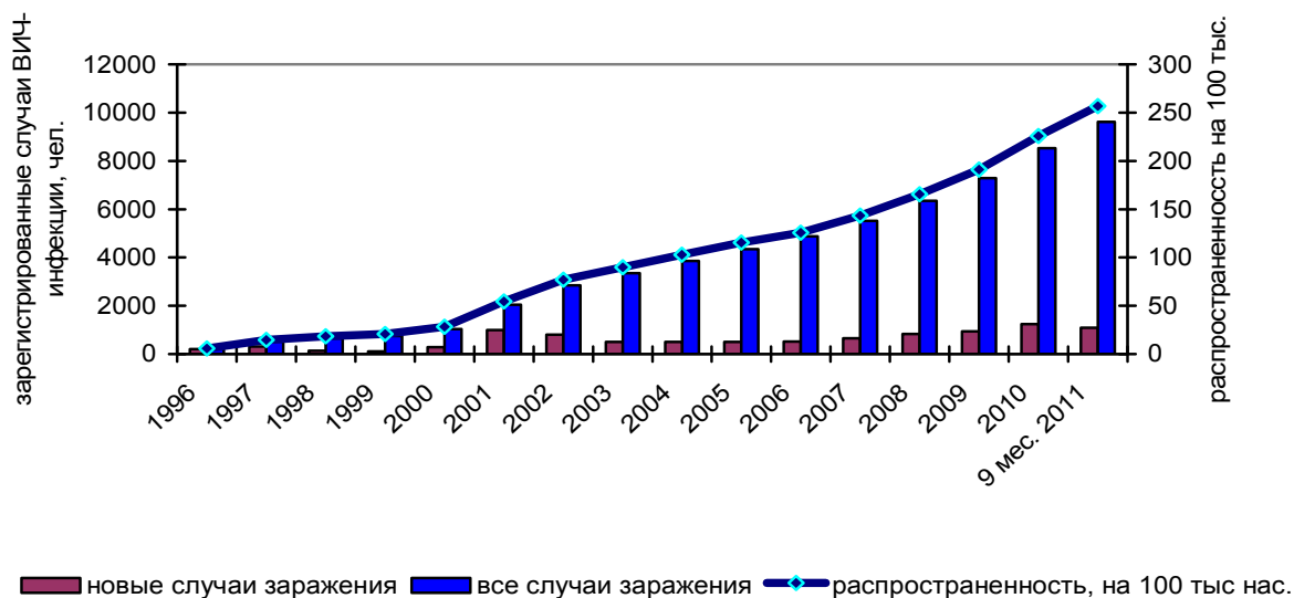
Рис.1 Официально зарегистрированные случаи заражения ВИЧ-инфекцией в Нижегородской области на 01.10.2011 года.

На 01.10.11 г. выявлено 9 619 ВИЧ-инфицированных, из них жителей Нижегородской области – 8 534 (показатель распространенности на 100 тыс. населения – 256,8) (рис.1). В эпидемический процесс вовлечены все районы области и города Н.Новгород, Арзамас, Дзержинск и Саров.